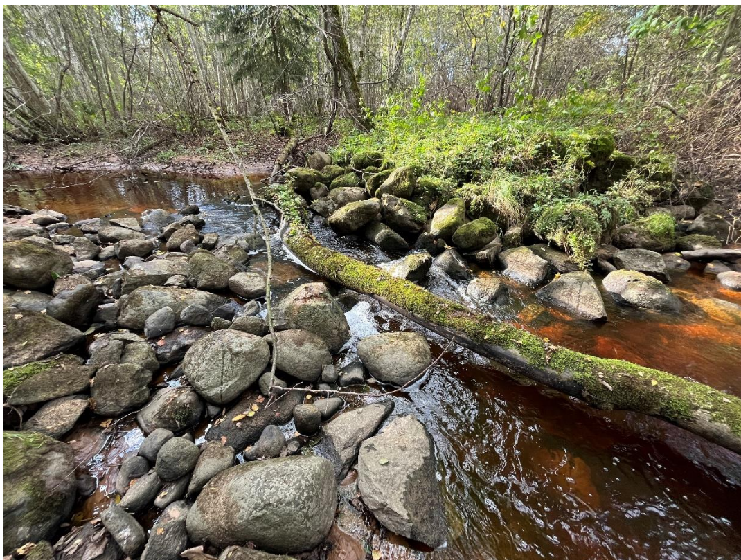
Joonis 3. Paremkaaldalt vaade kivipaisule.