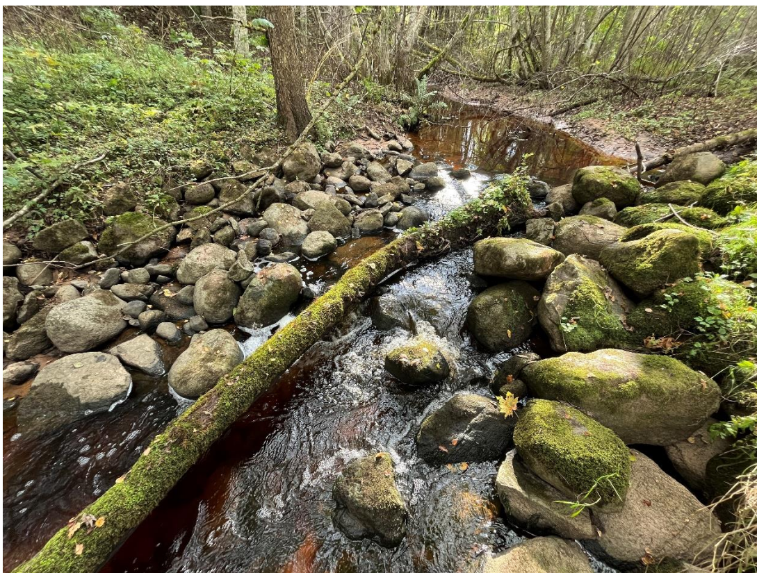
Joonis 4. Vasakkaldalt vaade kivipaisule.