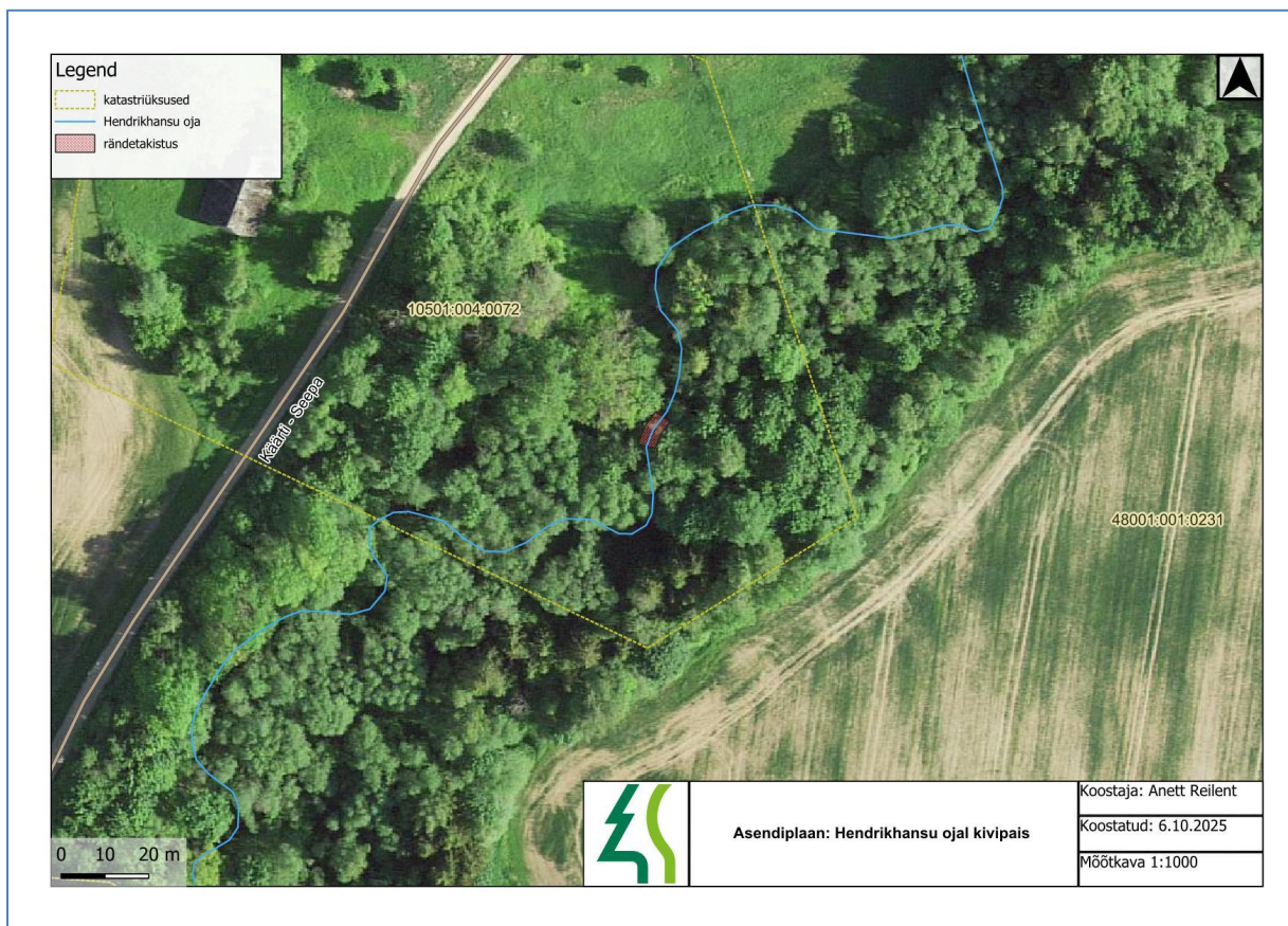
Joonis 1. Hendrikhansu oja teise kivipaisu asendiplaan